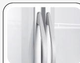
Tirador de aluminio externo