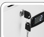
Cerradura de serie