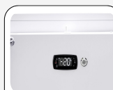
Termostato digital y cerradura de serie